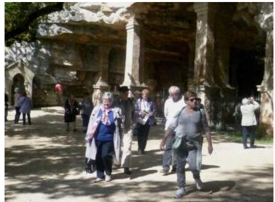
Visite de Rocamadour