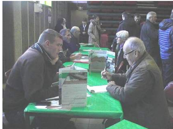
9/12/2016 Forum d'entreprises forestières

Si notre association vous intéresse, même à titre de découverte, n'hésitez pas à nous contacter.