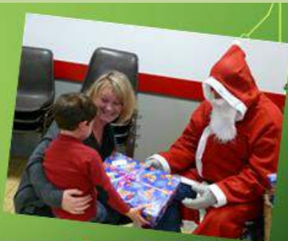
La fête du rêve pour les enfants