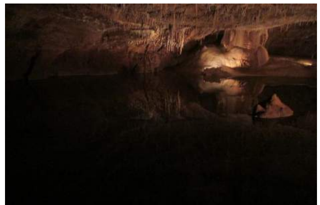
La grotte de Lacave

Le voyage organisé par notre club seul a attiré 30 adhérents (nous aurions souhaité plus), qui pour une modeste participation de 35 euros, ont passé une excellente journée en Périgord avec visite de