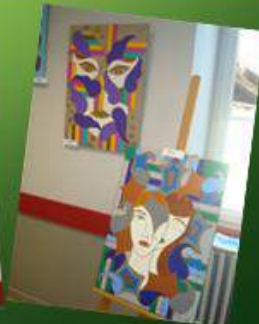
Exposition-vente organisée par « Les trésors cachés » 29 juillet