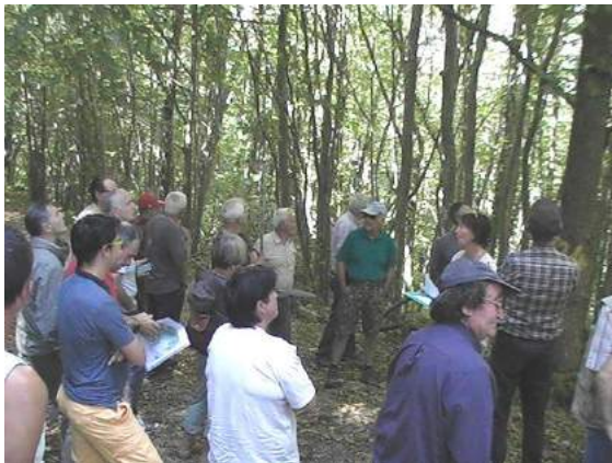
9/9/2016 Gestion d'une forêt de feuillus.

Bien sûr, nous avons poursuivi nos animations maintenant habituelles auprès de nos adhérents : études de situations forestières; prestations (recherches de bornes et limites); etc.. Ceci se déroule toujours en étroite collaboration avec le Centre National de la Propriété Forestière, notre référent technique. Nous avons également réalisé deux présentations sur le thème de la forêt auprès des élèves de CM2, écoles de Pontgibaud et Verneugheol. Côté matériel, nous continuons à nous équiper grâce à l'aide financière 2016 du Conseil Départemental du Puy de Dôme.