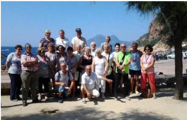
Voyage en Corse

Nos activités en 2016, se résument comme chaque année à 3 voyages. Avec nos amis de Pouzol nous avons partagés: 8 jours inoubliables en Corse. 1 journée à Rocamadour, aux grottes de Lacave.