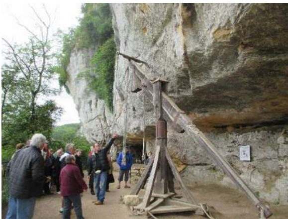
La roche St-Christophe