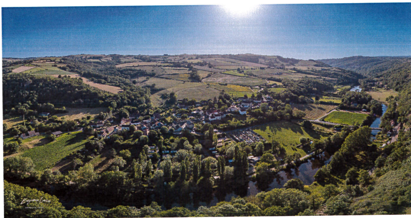
Vue aérienne du Bourg de Saint Gal sur Sioule